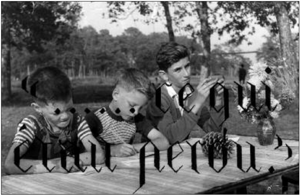
Au Bourdiou, en 1953